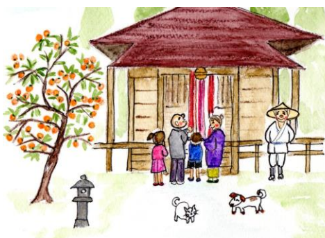
市民センターまつりのテーマイラスト