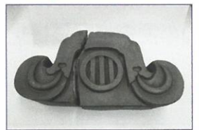
(焼けた養賢堂の瓦)

「戦時中の暮らし」をテーマに、戦災復興記念館資料展示室展示品の一部を展示します。