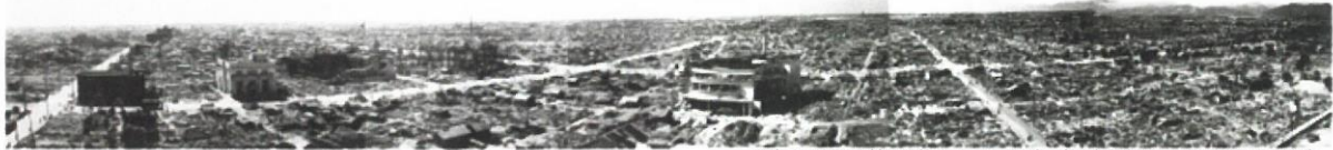
岐阜市市街地焼け跡パノラマ写真